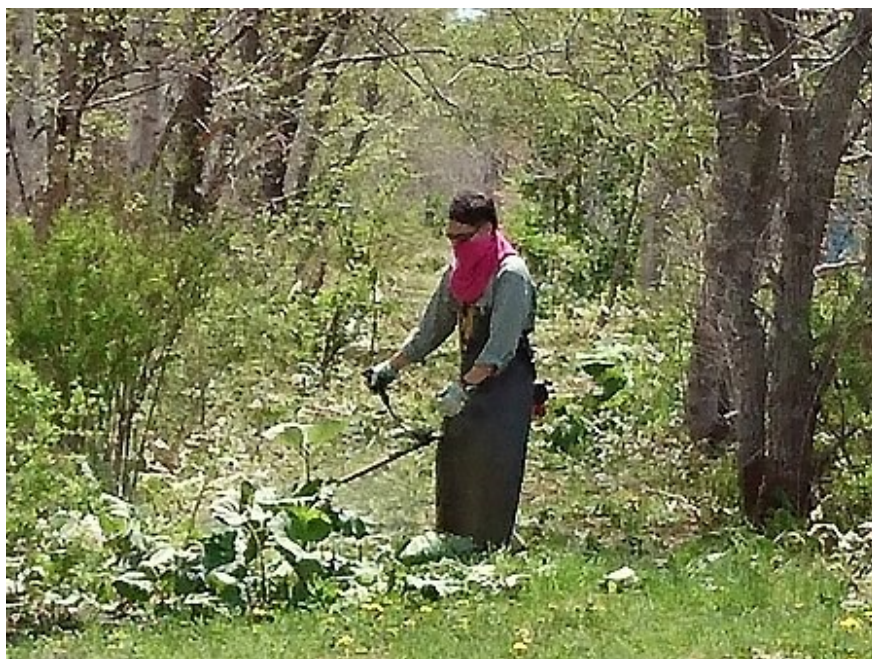
整備作業中。暑さとの戦いです…