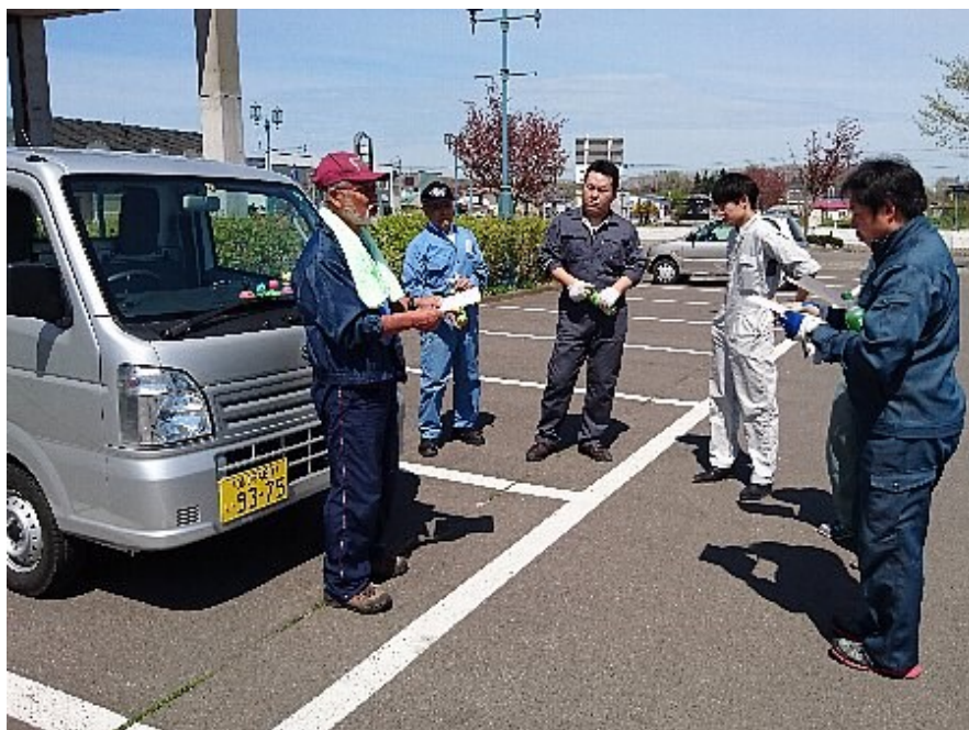
作業前に入念な打合せ