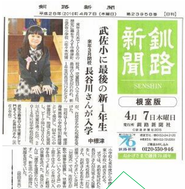
4月7日付けの釧路新聞に武佐の入学式の事が掲載されました。