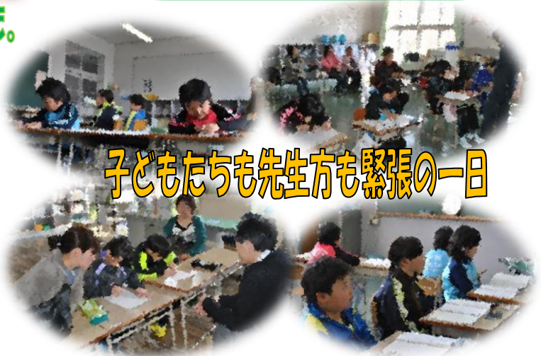
子どもたちも先生方も緊張の一日