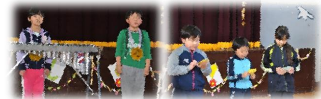
各学年の出し物をして過ごしました。

先日の参観日ですが、お忙しい中、御出席いただきありがとうございました。学校はいつでも皆様を歓迎いたしますのでいつでも学校においでいただき、子どもたちの様子をご覧ください。お待ちしております。また、5月6日から家庭訪問が計画されています。お忙しい時期とは思いますが、よろしく御協力をお願いいたします。