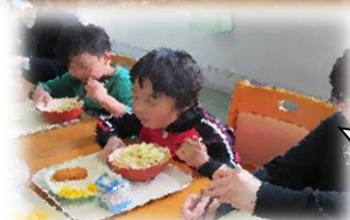
迎える会の後には月に一度の交流給食！！