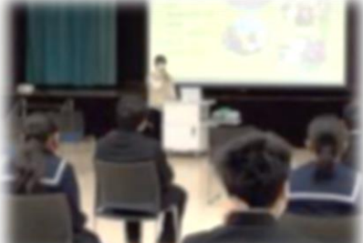
卒業生を講師に迎えた進路学習