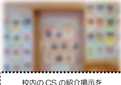
校内のCSの紹介掲示を 見やすく・わかりやすくしました