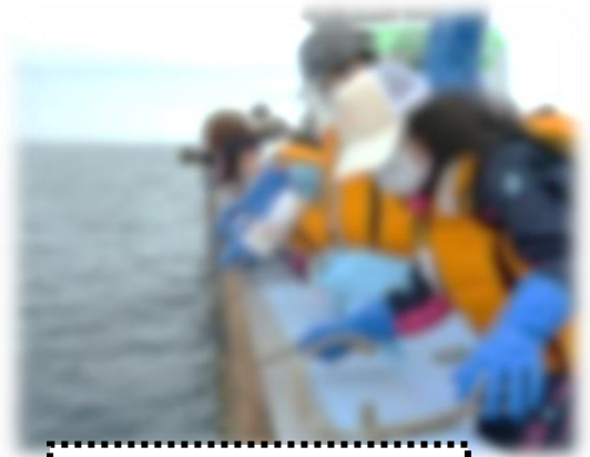
カキの養殖作業体験