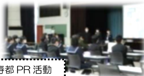
寿都 PR 活動