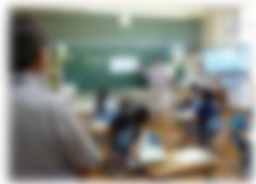
昨年の学校視察の様子