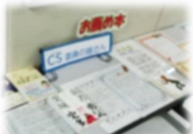
委員から生徒へのメッセージを掲示

生徒ひとりひとりが夢や目標に向かって切り開く力を育めるよう、CS委員が学校の応援団としてバックアップしていきます。