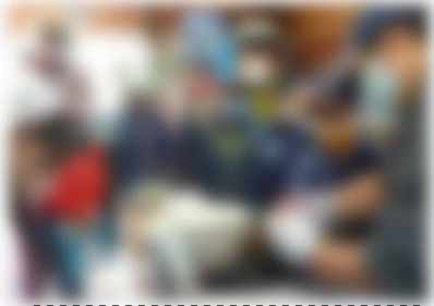
地域資源を活かした授業

昨年度より大きく委員が入れ替わり、これまでの取り組みに新しい風が吹き込まれています。今年度も学校と地域のさらなる相互理解に努めます。