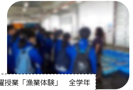
土曜授業「漁業体験」 全学年