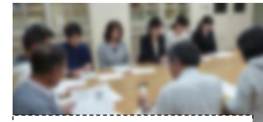
定例会に教職員が参加し意見交流

今年度も委員と児童が触れ合う機会を積極的に作っていきます。教職員との連携をより確かなものにし、委員を中心に子供たちを見守る目を地域ぐるみへ広げていくための活動に取り組みます。