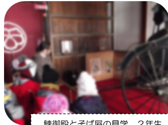
鯉御殿とそば屋の見学 2年生