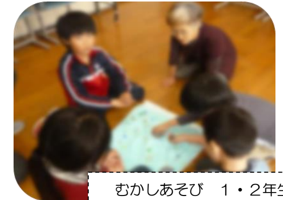
むかしあそび 1・2年生