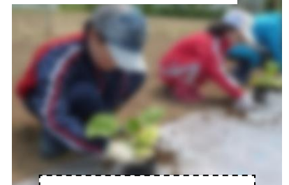
委員が授業を支援