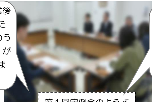
第1回定例会のようす