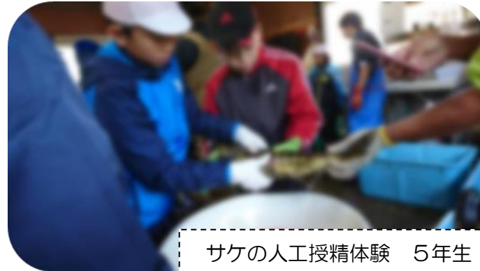
サケの人工授精体験 5年生