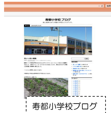
寿都小学校ブログ