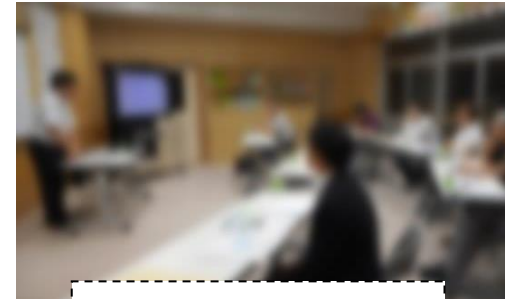
昨年度の研修会のようす

昨年度新たに実施した委員の研修会を今年度はさらに充実させていきます。また、学校運営協議会の活動を知ってもらうための広報活動を強化して行っています。