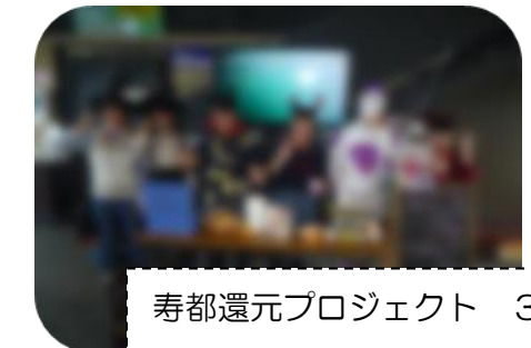
寿都還元プロジェクト 3年生

各小・中学校のホームページ・ブログを随時更新しています。ブログでは、学校支援活動のようすも掲載しています。ぜひご覧ください♪