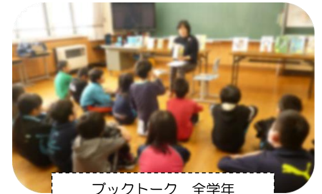
ブックトーク 全学年