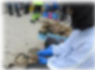
カキの洗浄選別体験