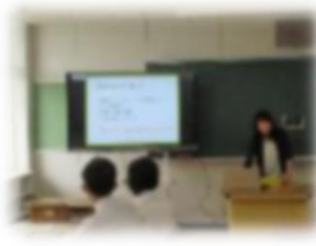
マインドマップの作成