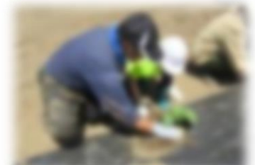
ハロウィンかぼちゃの苗植え